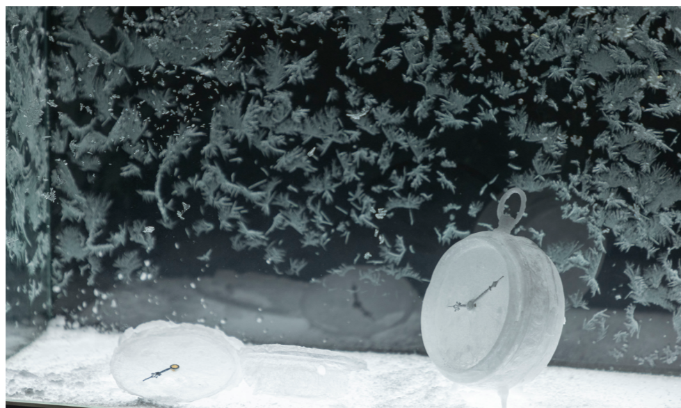
Aiko MIYANAGA, "night voyage -clock-", 2023 boîte en verre, naphthaline, technique mixte, 20 x 55 x 40 cm (socle 22 x 57 x 100 cm) Photo : Kioku Keizo. © MIYANAGA Aiko, Courtesy of Toyama Glass Art Museum / Mizuma Art Gallery / Le Clezio Gallery

Poussée par l'envie de retrouver l'esprit, la créativité et les aspirations du Paris du début du XX e siècle, Aiko Miyanaga a commencé à couler du verre dans ces moules