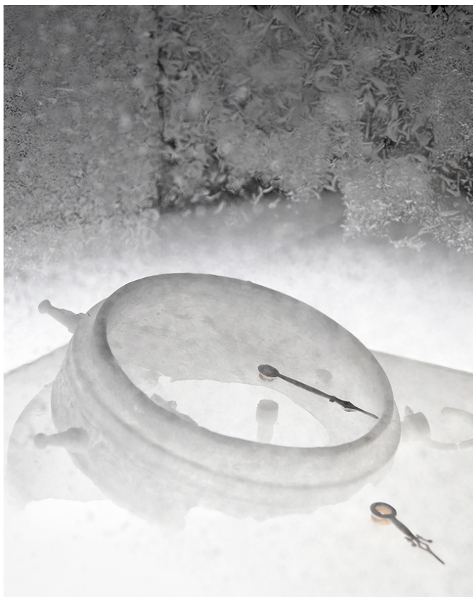
Aiko MIYANAGA, "night voyage -clock-" (détail), 2010 boîte en verre, naphthaline, technique mixte, 22.4 x 30.5 x 19 cm