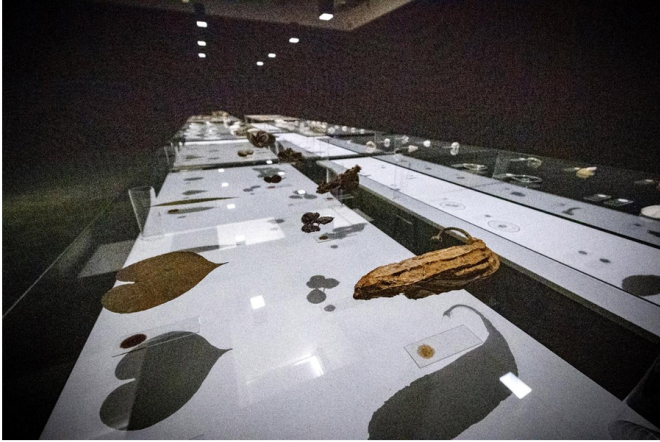
Elsa Salonen on kerännyt installaationsa luonnonmateriaalit Indonesiasta. Mikroskooppien aluslasille maalatut luonnonhenget näkee vain lähietäisyydeltä.