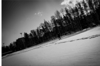
Kari Vehosalon ateljee sijaitsee hetsinkiläisessä Kontulan lähössä.