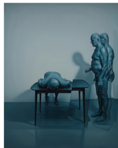
Three Figures on a Stage (2017). Vehosalon teokset ovat useimmiten isokokoisia, ja tämänkin öljyvärimaalauksen korkeus on lähes kaksi metriä.

Vuonna 2012 valmistunut maalaus sisältää juuri ne elementit, joista Kari Vehosalon taide tunnetaan. Tutun ja turvallisen takana ryömii jotakin häiritsevää, joka sysää ajatukset raiteiltaan. Teosten yhteydessä tulee vääjäämättä esiin psykoanalyysin perustajan, itävaltalaisen Sigmund Freudin käyttämä unheimlich -termi, joka viittaa tietynlaiseen kammottavuuteen ja epämukavuuteen.