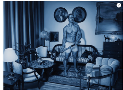
Kari Vehosalo Young Adults V, 2020, öljy kankaalla, 145 x 195 cm

Samalla suhteessain 1900-lukuun todellisuutta jonkinlainen etäisyys, jota olen harjoittanut taiteessain maalaamalla toisaalla olemisen tunnetta. Se on taas yksi taiteeni tehokeino ja viestinnän tapo: pyrin etäisyyttäminen kuvassain asiat taiduudesta. Etäisyyttäminen asoita on helpompi tarkastella sellaisina kuin ne ovat.