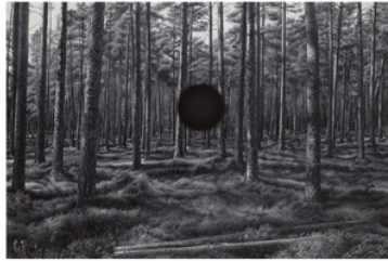
Kari Vehosalo Object, 2023, öljy kankaalla, 120 x 180 cm

Ajattelen taidetta kielellä ja eri kielissä on eri voimavaroja. Näitä voimavaroja täytyy käyttää oikeassa paikassa oikealla tavalla, jotta se sisältöinen kysymys, jonka haluaa välittää, tulee kommunikoidua oikealla tavalla. On siis edeltävä tutkittavan aiheen ehdoilla. Tästä seuraa kuitenkin haasteita, jos olet työskennellyt koko elämäsi maalaustaiteen parissa, et voi noin vain hypätä kuvaneistäjäksi. On rajansa sillä kuinka paljon erilaisia erikoistaitoja voi saavuttaa. Olen kuitenkin yrittänyt olla uskollinen ajatukselle taiteen kielestä. Väriä se tuottaa onnistuneempia ja väriä vähemmän onnistuneita tuloksia.