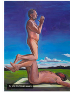
Jaan Toomik, Peinture à l'huile, 2002