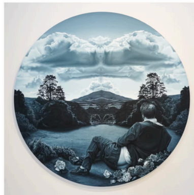
Something Wicked This Way Comes (While Thinking of Marquis de Sade) vuodelta 2012. Tarkemalla silmäyksellä teoksen romanttista kumpupilvistä löytyy jotakin yllättävää.

Kun kuvaa katselee tarkemmin, siitä paljastuu yksityiskohtia, jotka kummasuttavat: maisema on samalla tavalla symmetrinen kuin psykologiasta tuttu, ihmisen persoonallisuutta kartoittava Rorschachin musteläiskätesti. Pilvistä muodostuu naisen vulva, ja jostakin syystä miehen ruusujuuri ympäröimä takapuoli on osittain paljaana. Hämmennystä herättää teoksen sadomasokismin viittaava nimikin: Something Wicked This Way Comes (While Thinking of Marquis de Sade).