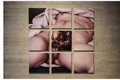
The Mystery of Sex (2020). Teoksessa yhdistyvät Caravagion Tuomaksen epäily (1602) ja Gustave Courbetin Maailman synti (1866), jossa alun perin makaa alaston nainen.

– Kukaan meistä ei halua olla työkalu, eikä kukaan meistä varmaankaan halua olla naula, jos joku toinen on vasara.